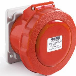
Ref. / Item 24373